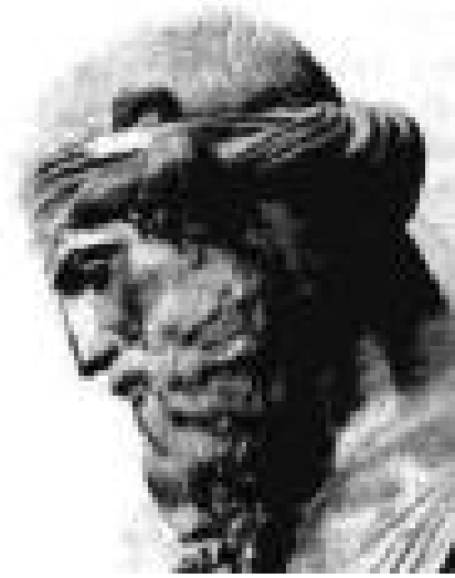
PLATON (427 – 347. pr. n. e.)

" Svaka duša teži dobru i poradi njega čini sve što čini."